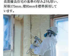
長期優良住宅の基準の厚みよりも厚い、厚み175mm、壁65mmを標準採用しています。

ハウスマスター 住宅保証 10年 白アリ保証 10年 ハウスマスター 地盤保証 20年 無料定期点検 3回 (10ヶ月、1年、2年)