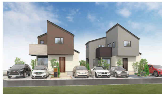
外観完成予想CG ※外観・掲載はイメージであり施工上の都合により変更となる場合がございます。