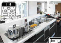
夜間電力利用プランでスマートな暮らしをエコキュート