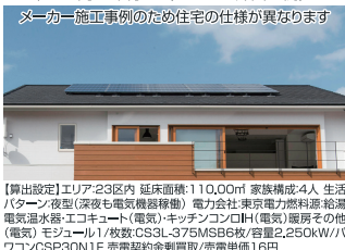
【算出設定】エリア23区内 延床面積:110.00㎡ 家族構成:4人 生活パターン:夜型(深夜も電気機器稼働) 電力会社:東京電力料率(標準) 電気温水器:エコキュート(電気) キッチンコンロH(電気) 暖房その他(電気) モジュール1/枚数:CS3L-375MSB6枚/容量:2,250kW/1/ワコンCSP30N1F 売電契約:余剰買取/売電単価:16円