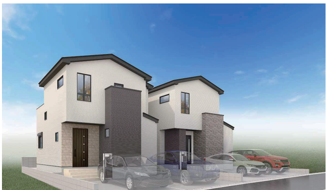
外観完成予想CG ※外構・植栽はイメージであり施工上の都合により変更となる場合がございます。