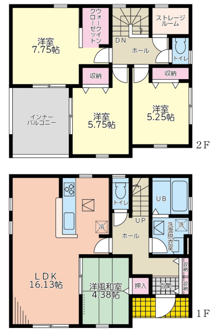
※間取り内の設置家具は配置例です。家具は販売価格には含まれません