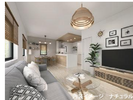
内装イメージ ナチュラル