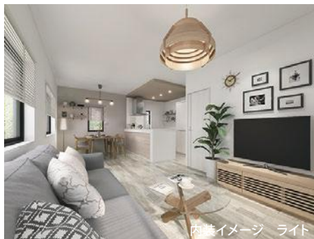
内装イメージ ライト