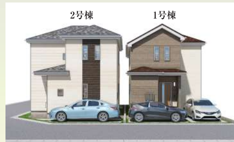
※イメージ図になります(実際の仕様、外観等異なる場合があります)。