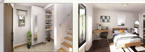
※イメージパースにつき実際とは多少異なる場合がございます。