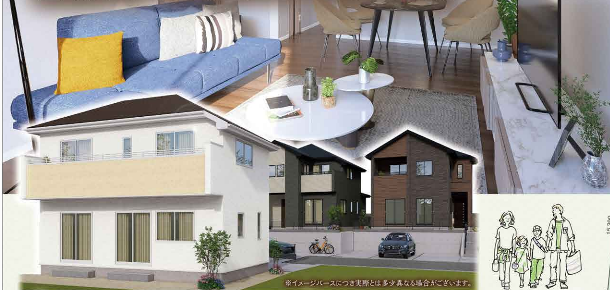
※イメージパースにつき実際とは多少異なる場合がございます。