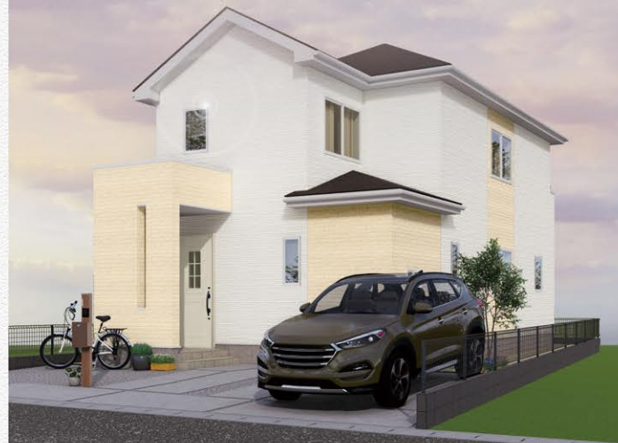
※イメージバスにつき実際とは多少異なる場合がございます。

一般的な建売住宅にはない工夫とアイデアを取り入れたデザイン住宅を創り上げました。生活動線や採光・通風を考慮して、使い易く便利な先進設備と充実の収納スペースなど暮らしやすさを追求した邸宅です。家族の成長を見守り続ける長期保証付き住宅で家族と共に末長く暮らしませんか？