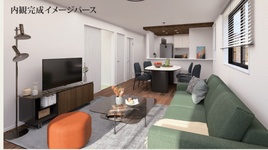
内観完成イメージパース

県道8号線へのアクセス良好! シューズインクローク ウォークインクローゼット完備! 徒歩圏内にコンビニ有! 敷地広々69坪以上!!自由度の高い物件!!