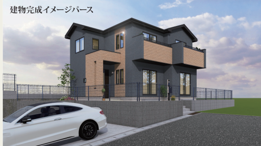
建物完成イメージパース