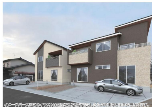
イメージパースとイラストは図面を基に描きおこなったもので実際とは多少異なります。

南道路に面する車庫スペース3台確保した2棟！ 収納を多く確保し生活利便性を向上させる企画設計をご覧ください！